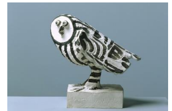
Pablo Picasso (1881–1973) Die Eule , 1952, 12.12. Gebrannter Ton, bemalt, 34 x 25 x 34,5 cm Hamburger Kunsthalle, erworben 1956 © Succession Picasso / VG Bild- Kunst, Bonn 2026

MIRA FORTE Pressesprecherin & Leiterin Presse- & Öffentlichkeitsarbeit