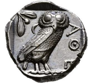
Athen, Tetradrachme (440–420 v. Chr.) Rückseite der Münze: Eule Silber, Ø 24 mm, 17,09 g

Die sich auf 1.500 m 2 erstreckenden Ausstellungsflächen im Erdgeschoss des Gründungsbaus (1869 eröffnet) und des Erweiterungsbaus (1919 eingeweiht) wurden speziell für SKULPTURAL teils aufwendig modernisiert und mit neu entwickelten Display-Elementen ausgestattet. Ermöglicht wird sowohl das umfassende Forschungsprojekt zu den Kleinstskulpturen als auch die Modernisierung der Räume und Präsentationsformen sowie die darauf aufbauende Ausstellungspräsentation mit einer Summe von insgesamt 4 Millionen Euro durch die Dorit & Alexander Otto Stiftung . Die Stiftung wirkt damit erneut als maßgebliche Förderin für die Hamburger Kunsthalle.