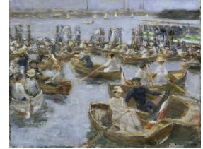
Max Liebermann (1847–1935) Abend am Uhlenhorster Fährhaus , 1910 Öl auf Leinwand, 77 x 96 cm

Der Impressionismus, der ab den 1870er Jahren in Frankreich entstand und sich zunächst dort etablierte, verlor bereits mit Beginn des Ersten Weltkriegs in seinem Geburtsland an Bedeutung. Hingegen reichten die impressionistischen